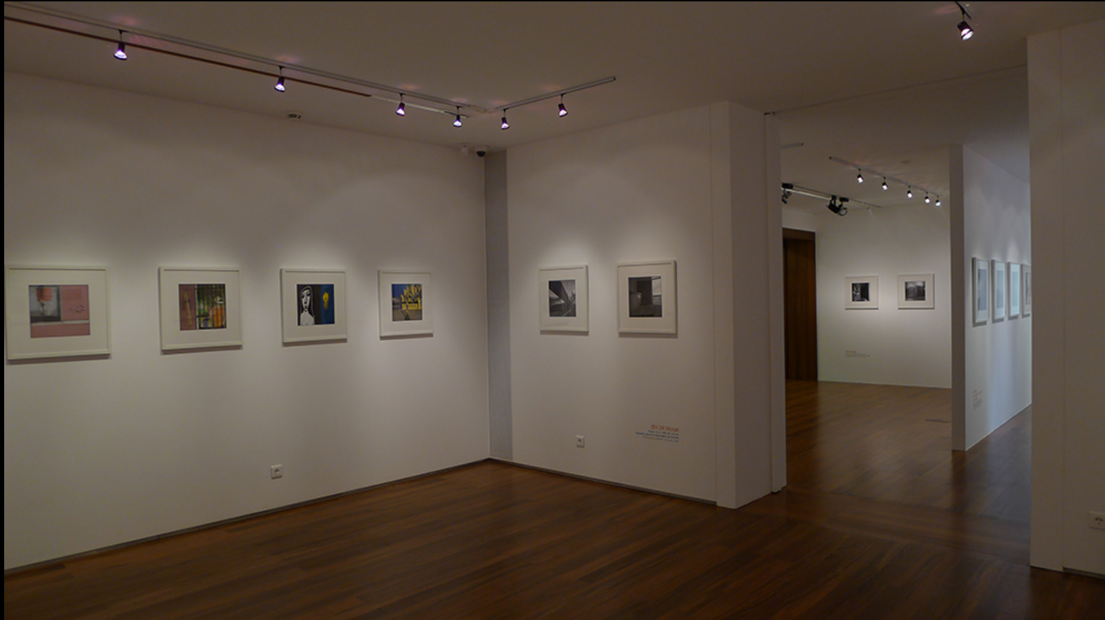
Compendium – BH 24 horas