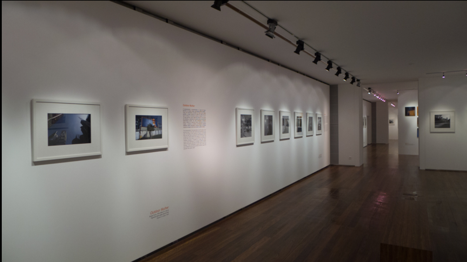
Outdoor Mulher – Avenida Paulista