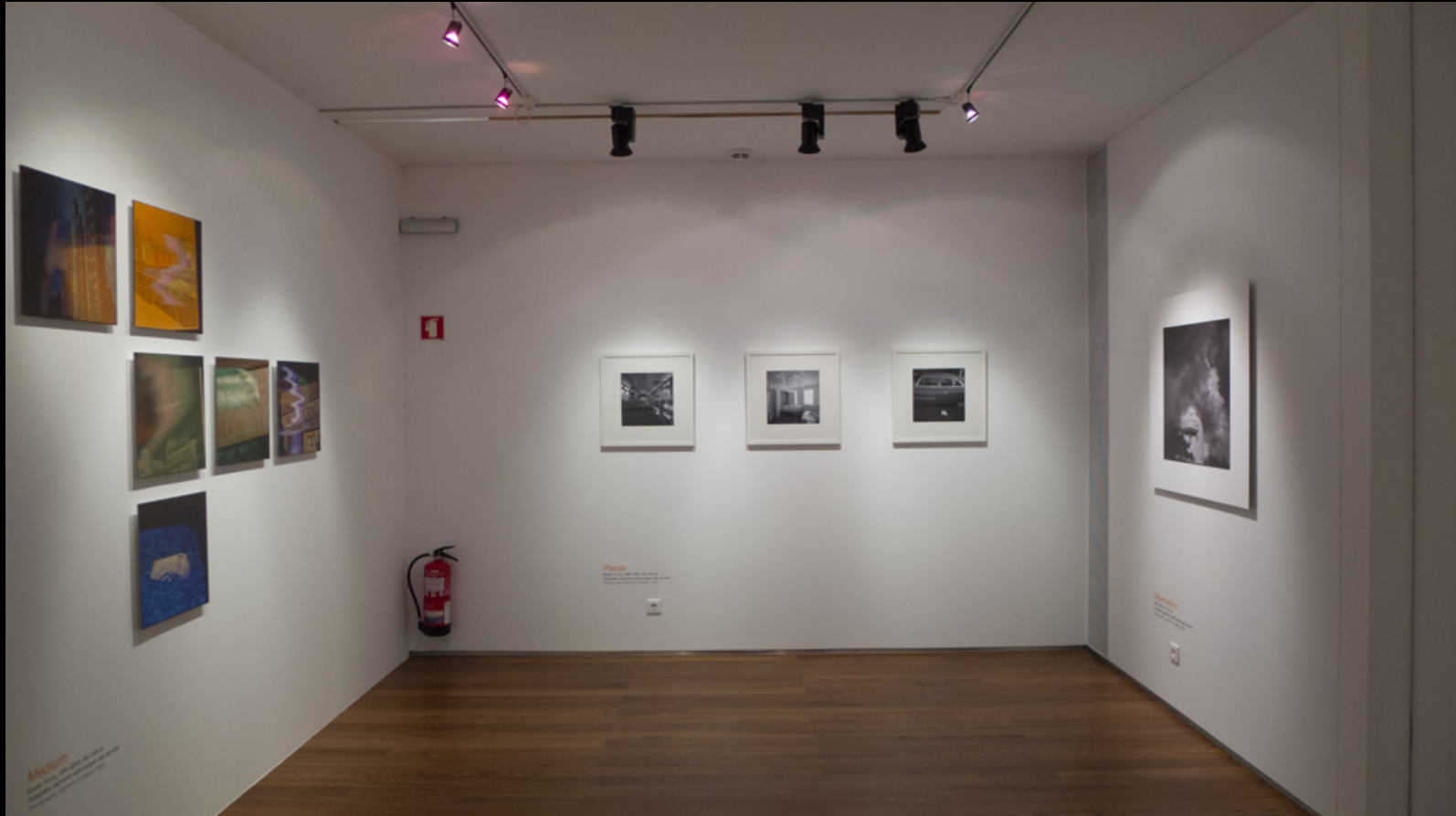
Medium – Places – Observatório