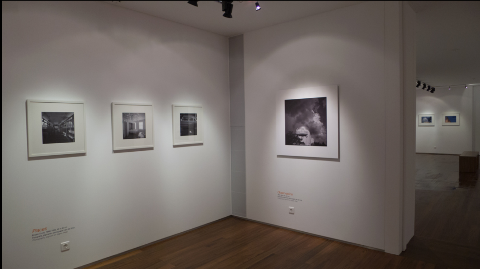
Places – Observatório