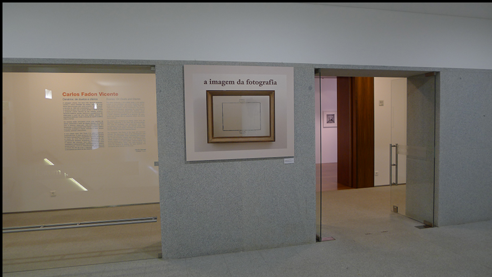
A imagem da fotografia – entrada da exposição