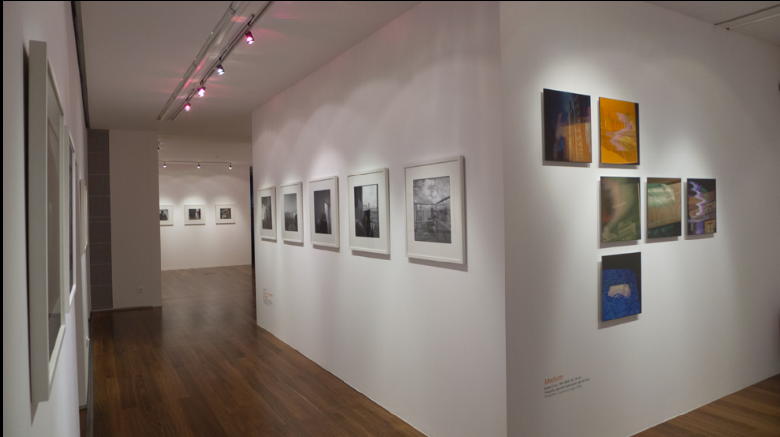
Duetos – Medium