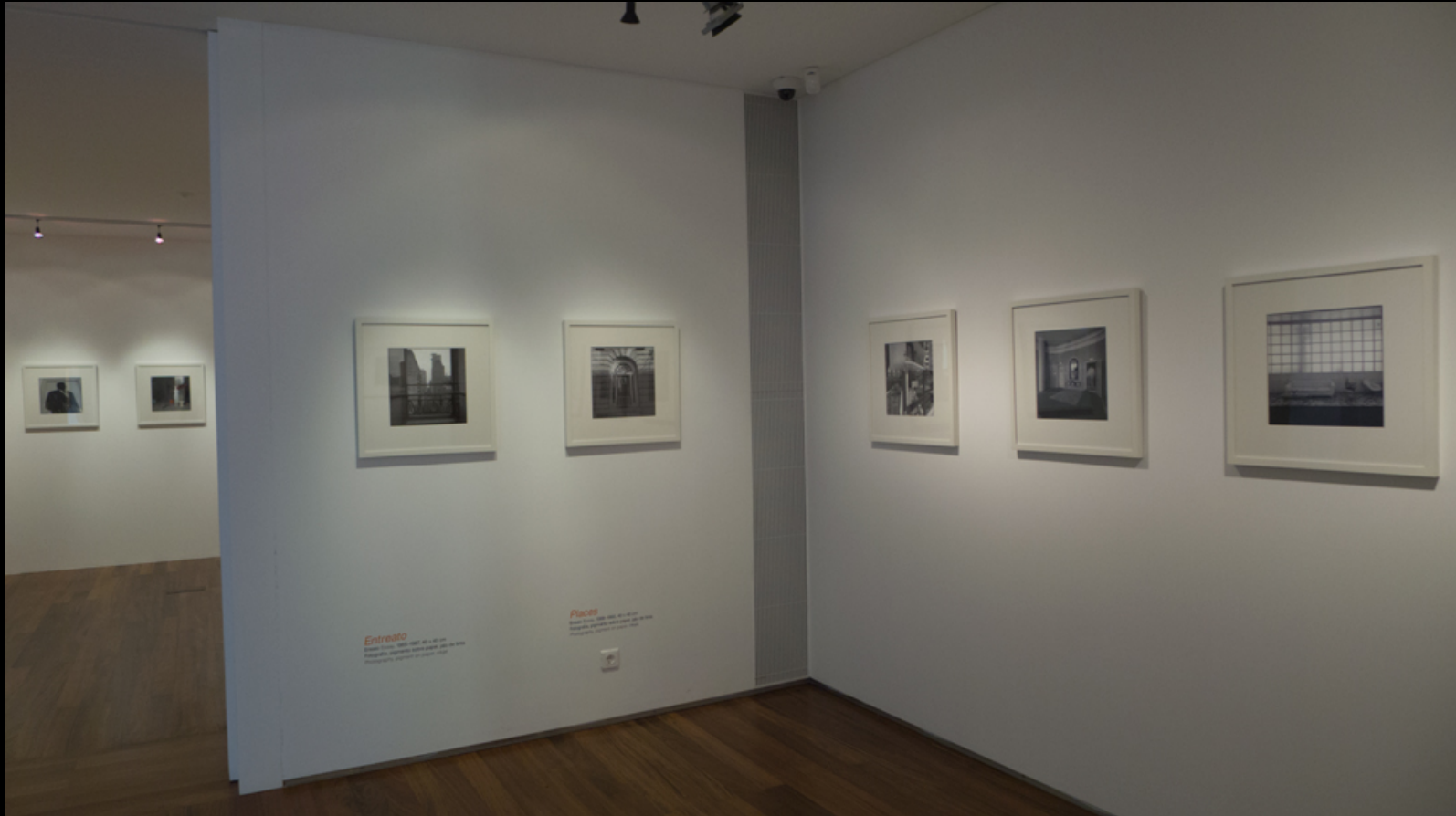
Entreato – Places – Entradas