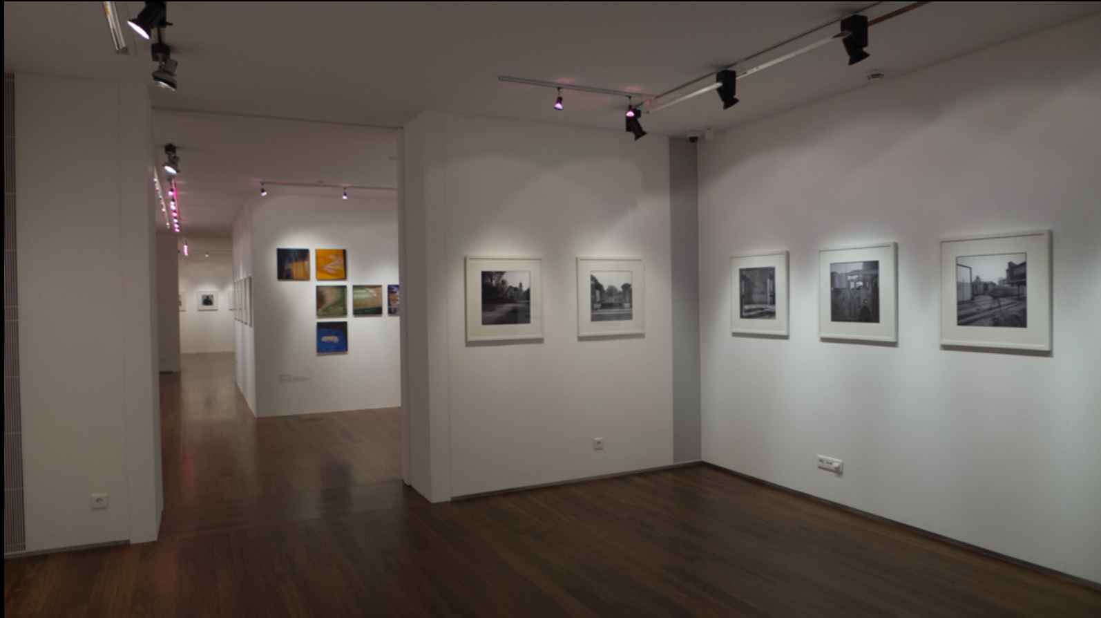
Medium – Avenida Paulista