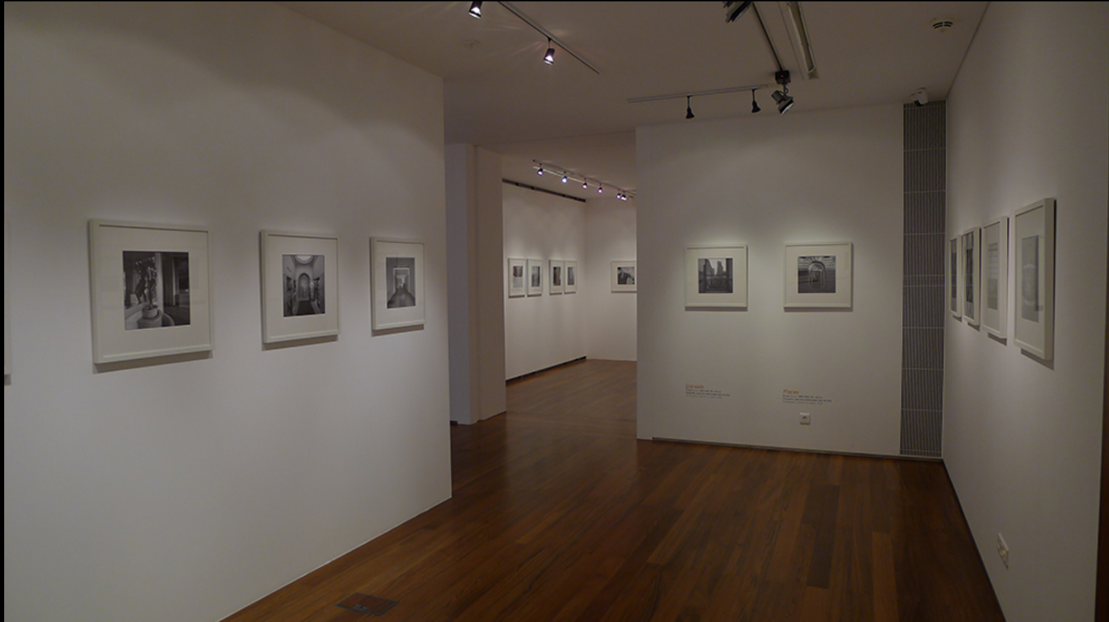
Entradas – Entreato – Places