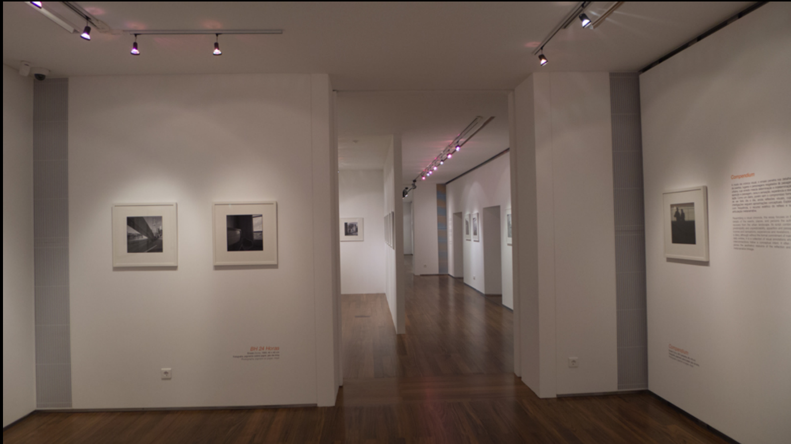
BH 24 horas – Compendium