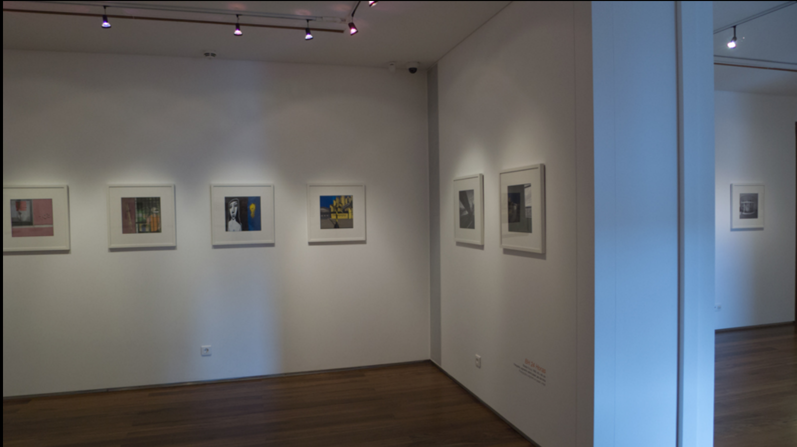
Compendium – BH 24 horas